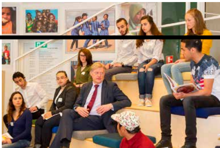
Het Jaarbericht Kinderrechten is op 3 juni 2016 door jongeren van de ISK school uit Utrecht en het jongerenpanel van UNICEF overhandigd aan Van Rijn, staatssecretaris van Volksgezondheid, Welzijn en Sport.

Deze tekst is afkomstig uit Jaarbericht Kinderrechten 2016. Het Jaarbericht is de jaarlijkse graadmeter voor de situatie van kinderen in Nederland van Defence for Children en UNICEF Nederland.